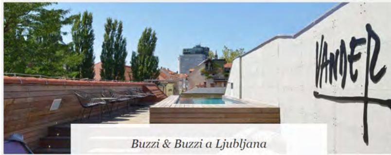
Buzzi & Buzzi a Ljubljana

Il progetto illuminotecnico per l'Urbani Resort Vander 24/05/2016 - Nella suggestiva cornice del centro storico di Ljubljana, ha preso vita il nuovo progetto illuminotecnico di Buzzi & Buzzi : l'illuminazione dell' Urbani Resort Vander .