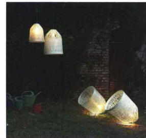
KARMAN BLACKOUT design Matteo Ugolini

Lampada indoor e outdoor, disponibile a sospensione e piantana. Dal centro del diffusore cocoon, realizzato in vetroresina bianca o trasparente a forma di filamento, pende un elemento semisferico che, oltre a fungere armonicamente da contrappeso, contiene delle candele offrendo una alternativa fonte di illuminazione in caso di blackout.