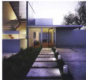
BUZZI & BUZZI MOND design Carlo Colombo

Apparecchio illuminotecnico da terra per esterni caratterizzato da linee semplici e pulite. Realizzato in DurCoral®, materiale due volte più duro del cemento, antivandalico, non deteriorabile, resistente al gelo e agli agenti atmosferici, insensibile ai raggi ultravioletti e trattabile con qualsiasi tipo di finitura e pittura. Disponibile con sorgente LED di ultima generazione da max 18W.