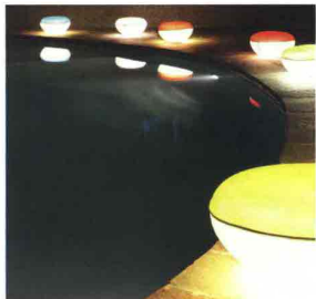
OLUCE PILL-LOW 219 design Francesco Rota

Lampada da esterno e interno a luce diffusa in polietilene bianco con rivestimento in tessuto lavabile per esterni. Utilizzabile anche come seduta.