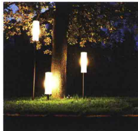
LUMEN CENTER ITALIA TAKÈ OPEN AIR design VillaTosca

Iconica famiglia di lampade per esterno a sorgente LED dalla grande flessibilità d'uso e personalità estetica. Dotata di diffusore modulare in polietilene bianco opale, realizzato in rotazionale a forma di ramo di bambù. Una gamma di accessori per il fissaggio permette di adeguare l'installazione dell'apparecchio a specifiche esigenze di progetto. Disponibile in tre diverse altezze.