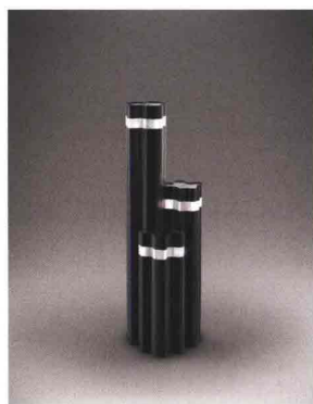
LUCEPLAN POD LENS design Ross Lovegrove

Lampada da esterni e da interni ispirata ai boccioli dei fiori. Una presenza discreta capace di connotare fortemente l'ambiente in cui viene inserita. Realizzata interamente in policarbonato, è progettata per essere appesa tra gli alberi, fissata a una parete, inserita in un palo o piantata nel terreno. Il suo diffusore colorato emana una luce intensa, variata e direzionata. Lo stelo profilato in vetroresina è inserito in una base di alluminio. Impermeabile e resistente ai raggi UV.