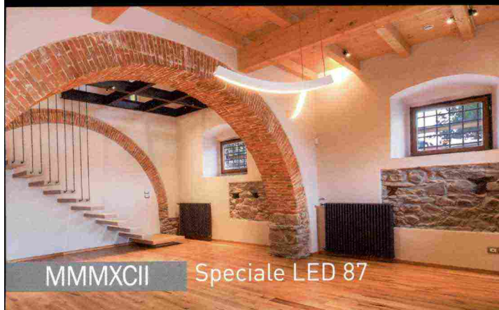
MMMXCII Speciale LED 87

parte integrante delle superfici, creando un output inedito. La proposta di Buzzi & Buzzi continua con il geometrico Invisiled IP65, protagonista dallo stile sleek. A scomparsa totale, Invisiled IP65 misura 80 mm ed è caratterizzato da una sorgente LED che emette una luce in perfetta sintonia con i volumi architettonici. Non poteva mancare Genius, altro dispositivo a scomparsa totale dalla forma circolare e di soli Ø 20 mm di diametro, installabile su soffitti in cartongesso o in muratura (utilizzato anche nella versione Genius IP65 per le aree caratterizzate da elevata umidità, come il bagno). Super compatto ma ultra efficiente, anch'esso realizzato in AirCoral®, Genius è un top di gamma richiestissimo per ogni tipologia di ambiente. Il design circolare caratterizza anche Globe,